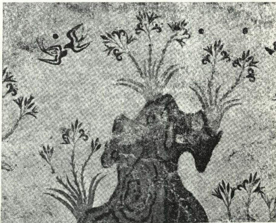
Fresc grec de la Primavera (Museu Nacional d'Atenes)