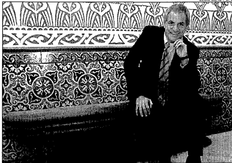
Josep Lange. Un dels científics més destacats en la lluita contra la sida.

Lange, però, va dir que «no s'està buscant». Segons el catedràtic, per aconseguir la vacuna de la prevenció de la sida caldria «la complicitat entre la indústria i el sector públic», però, en canvi, «el treball s'està fent de forma molt