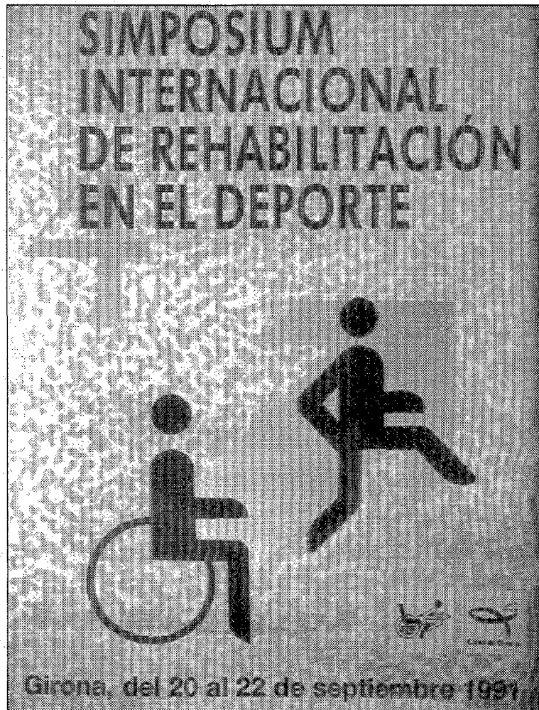
Un Simposi important.

matí i durant tot el dia es tractaran temes com la integració dels minusvàlids en l'esport, la valoració i classificació de les minusvàlies, l'esport com a rehabilitació, anàlisi del moviment i l'esport en els lesionats medul·lars, en els amputats, els paralítics cerebrals i deficients visuals.