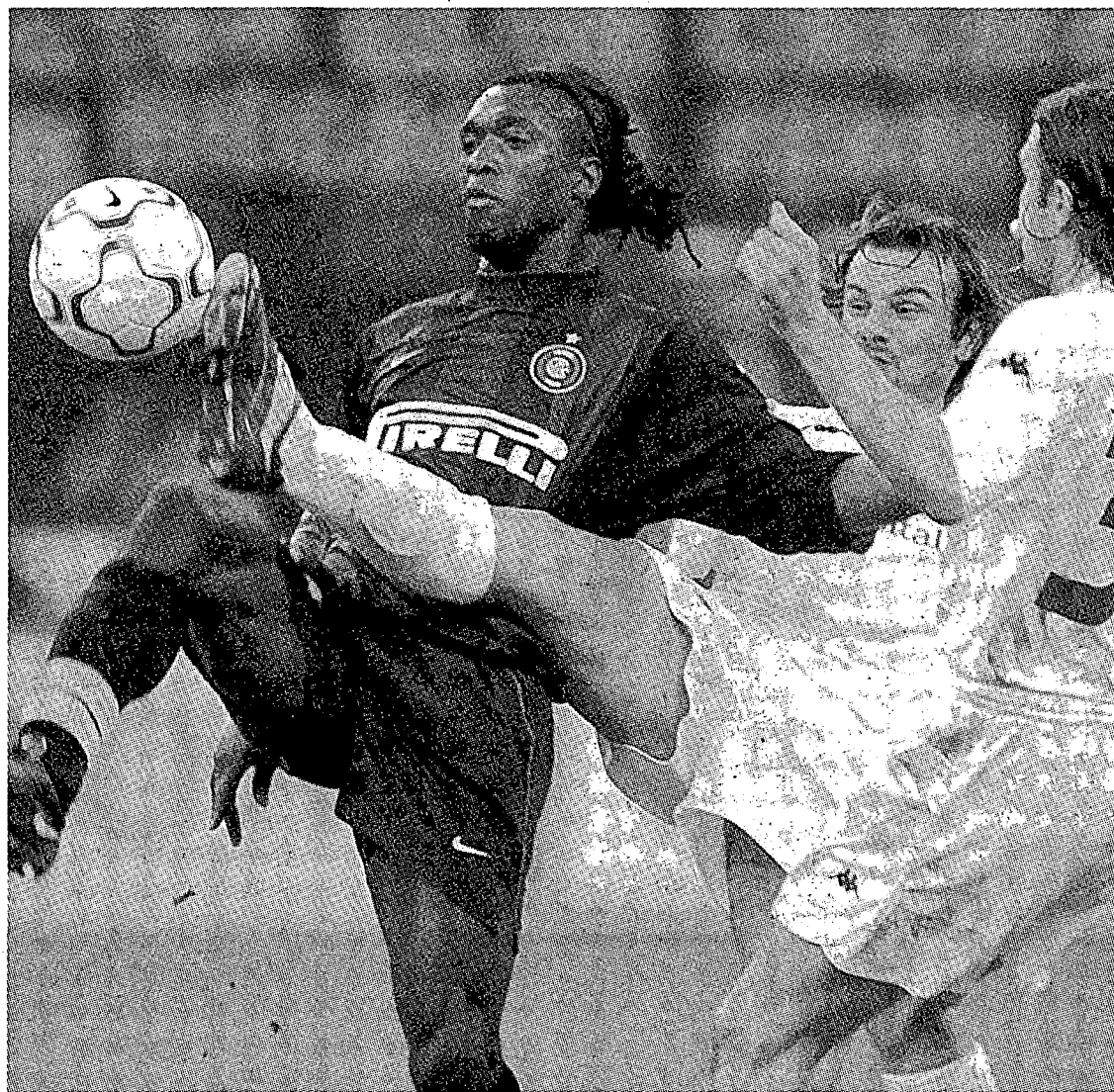
Clarence Seedorf és un dels noms que ha transcendit.

➤ El club espera tancar les incorporacions abans del 31 de gener