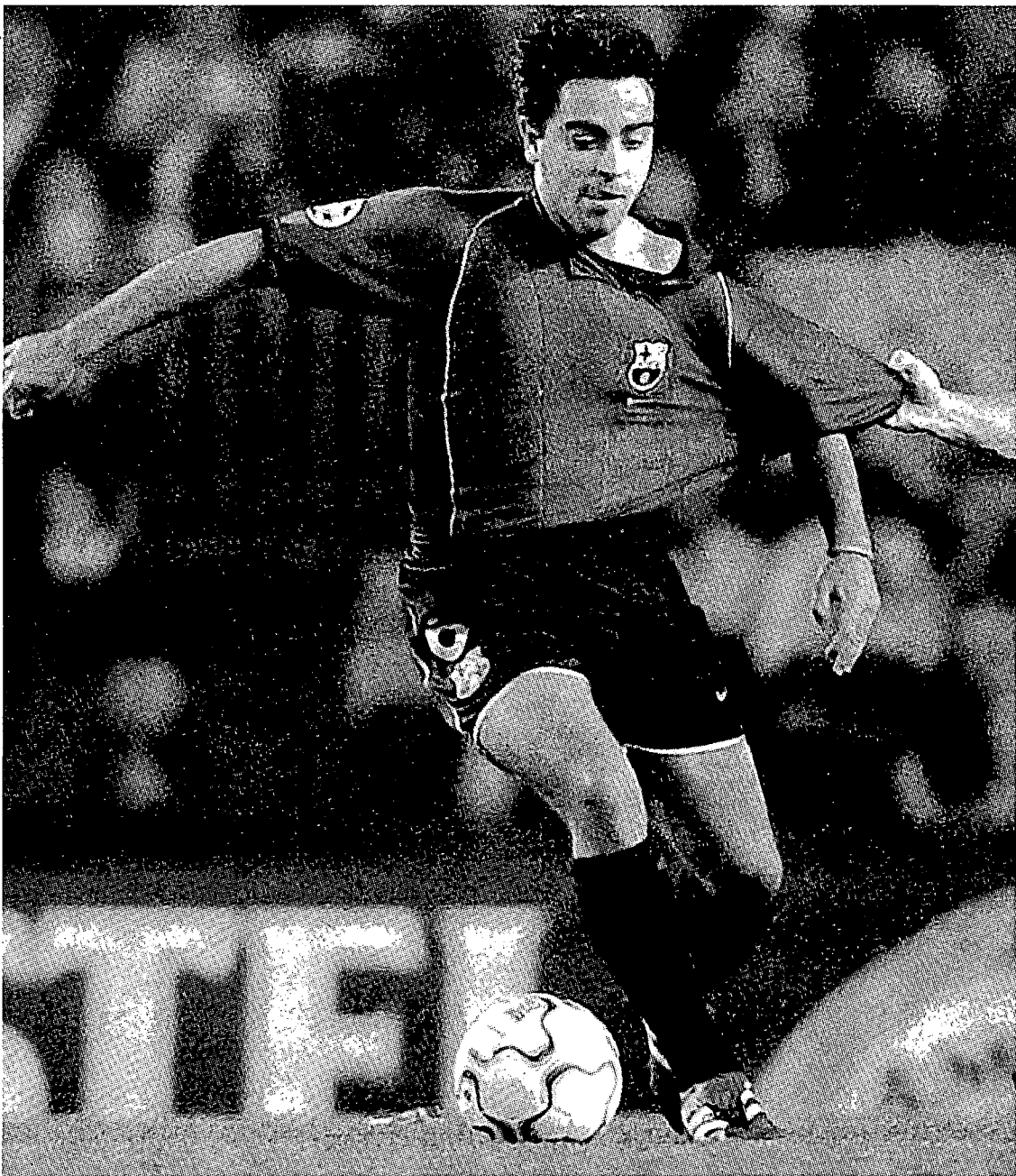
Xavi Hernández va deixar-se de romanços i va ser clar i català: «Vull que el Madrid perdi sempre.»

El jugador sap que el Barça no pot desaprofitar el calendari en un mes de gener on té una bona oportunitat d'escurçar els cinc punts que el separen dels madrilenys: «Sabem que tenim més partits a casa contra rivals que en aparença no són tan complicats. Amb tot, en aquesta lliga qualsevol equip et complica la vida. Hem de demostrar la nostra superioritat al camp, i sobretot guanyar.» Xavi no dubta que el partit contra el Saragossa ha de significar el punt d'inflexió: «Vam fer les coses bé, quan veníem d'una setmana tensa i amb molta pressió. Ara, l'ambient està molt més tranquil i hem d'aprofitar-ho; i més havent assolit una victòria que ens fa tenir