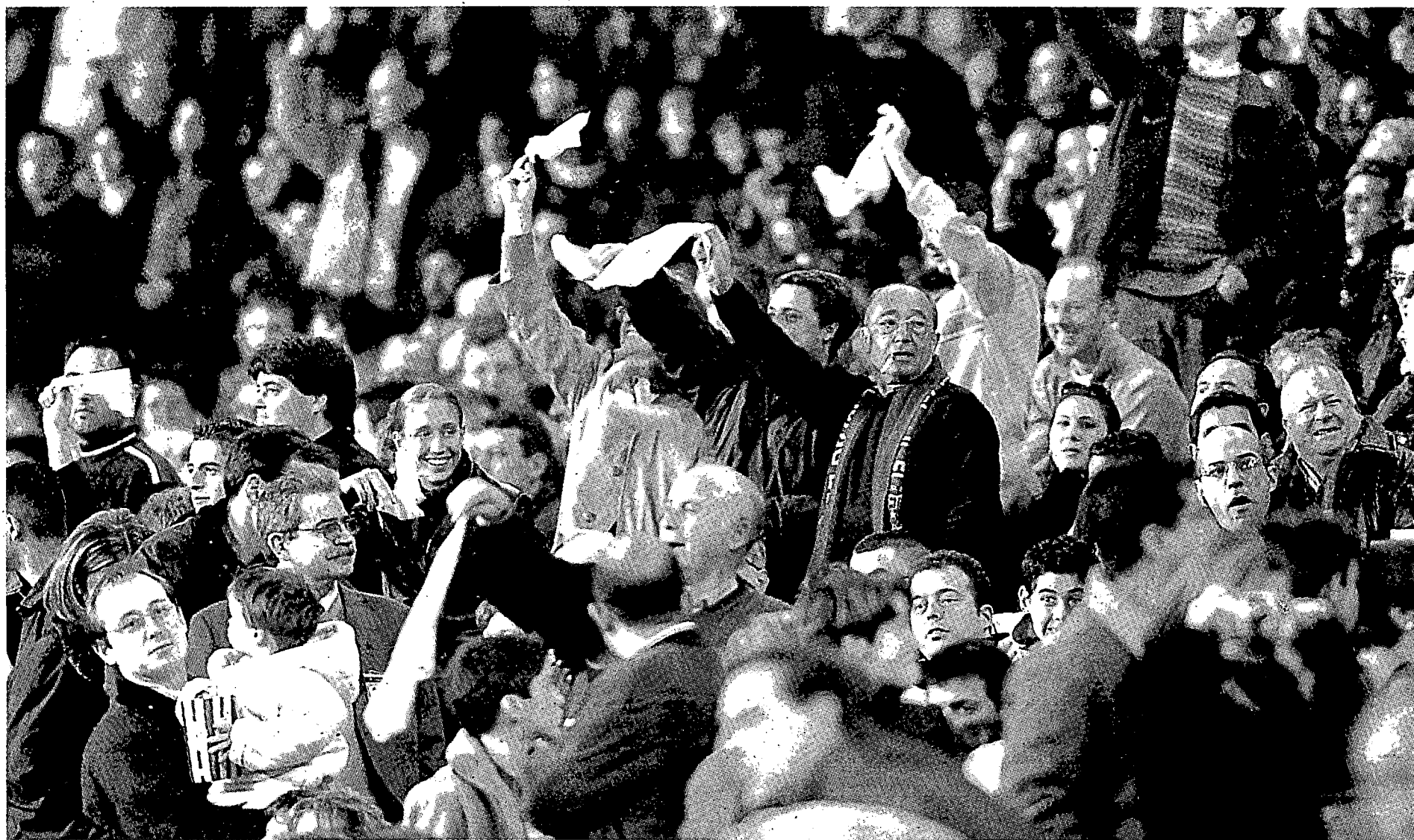
La graderia del Camp Nou es mostra indignada, en una imatge del partit contra l'Osasuna.