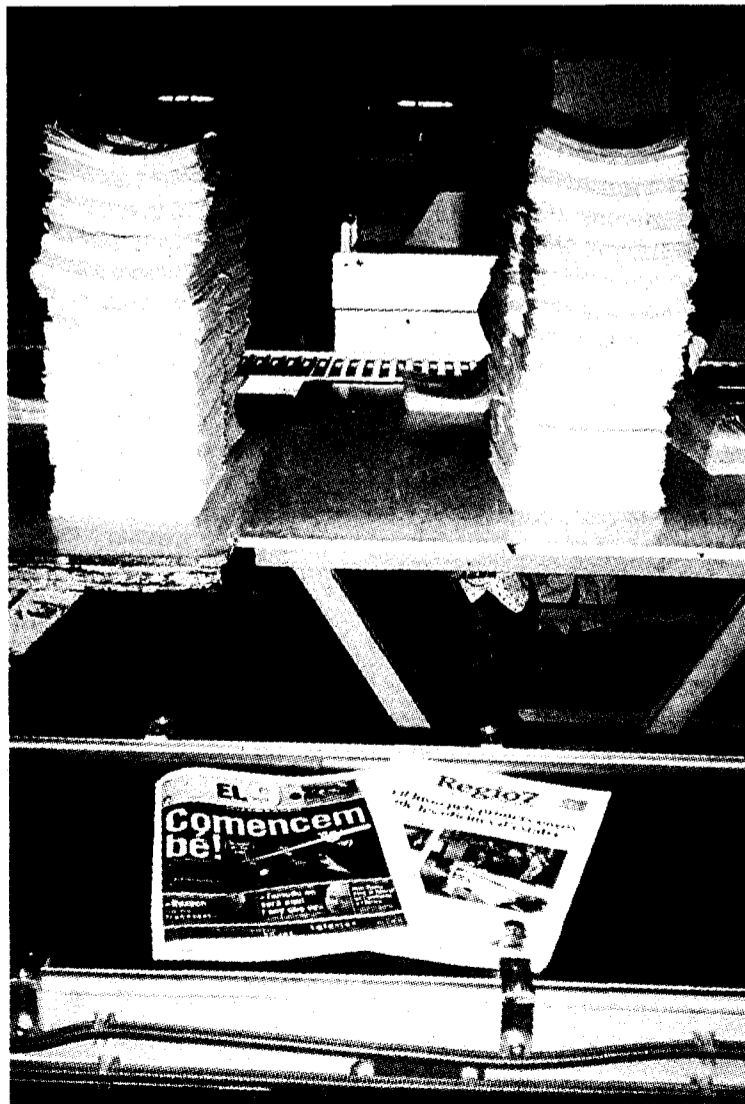
Alguns aspectes de la impressió i la venda del primer exemplar d'El 9, ahir a diferents ciutats de Catalunya.