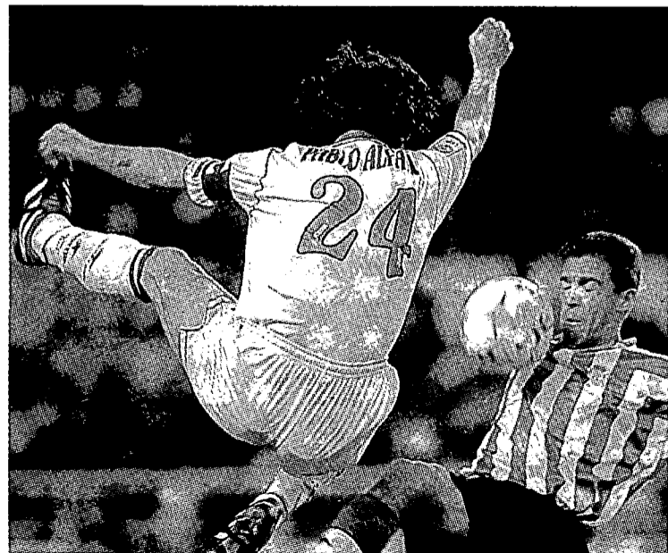
La rivalitat Sevilla-Betis també va arribar a Barcelona.

L'equip que entrena Vicente del Bosque, el Real Madrid, ha estat el més perjudicat aquesta temporada pels atacs vandàlics durant els desplaçaments. Els components de la plantilla madridista, doncs, han hagut de patir moments de gran tensió, tot i que l'autocar en què viatgen els ha servit d'escut. El vehicle dels blancs, però, va quedar en un estat lamentable en la visita que van fer a València.