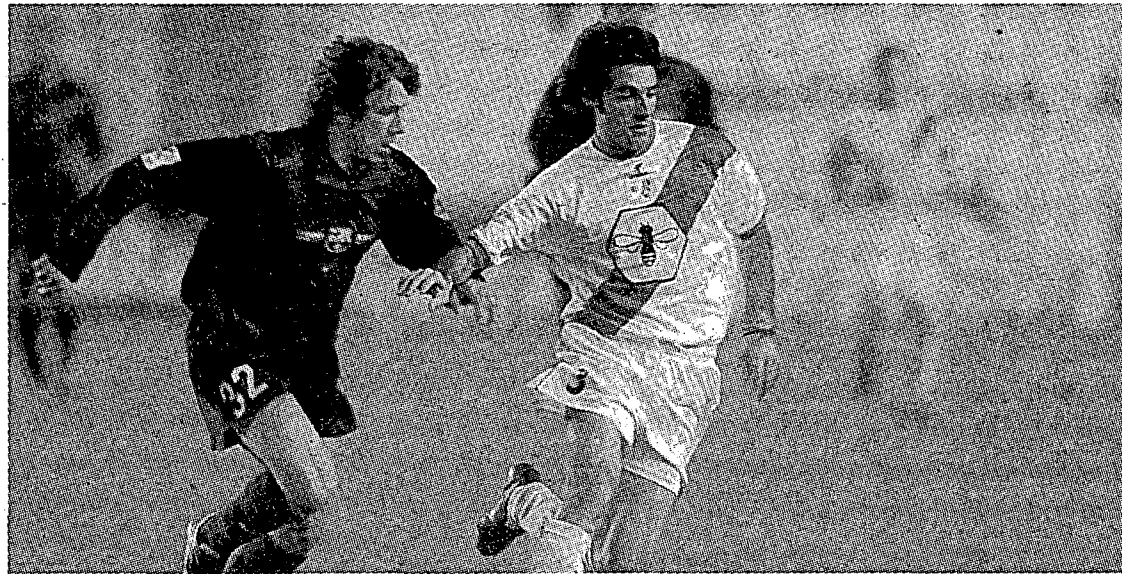
El Barcelona només ha perdut un partit en les seves deu visites al camp del Rayo.

Tres són només les victòries que ha aconseguit el Barcelona lluny del Camp Nou en la primera volta. Sevilla (1-2), Real Sociedad (0-2) i Vila-real (0-1)