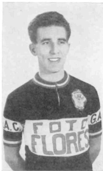
Antes de nada, una justificación a la foto. Choca su estatismo frente a la vitalidad y pujanza de quien representa. La imagen tiene ya unos

cuantos años. Diez o doce. Es una foto de principiante.