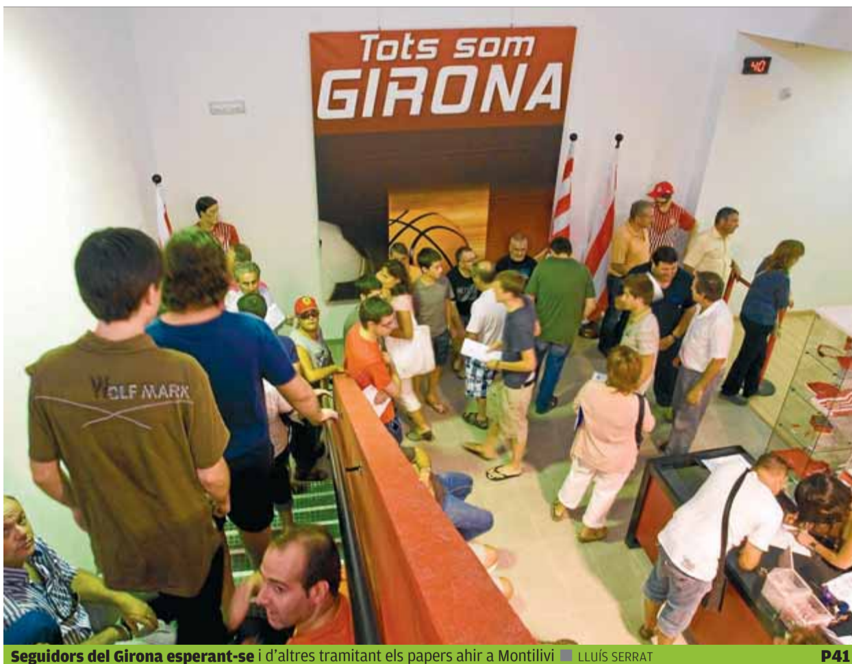
Seguidors del Girona esperant-se i d'altres tramitant els papers ahir a Montilivi

lions menys que l'anterior. Tot plegat repercuteix en les inversions del govern. ■ P2,3