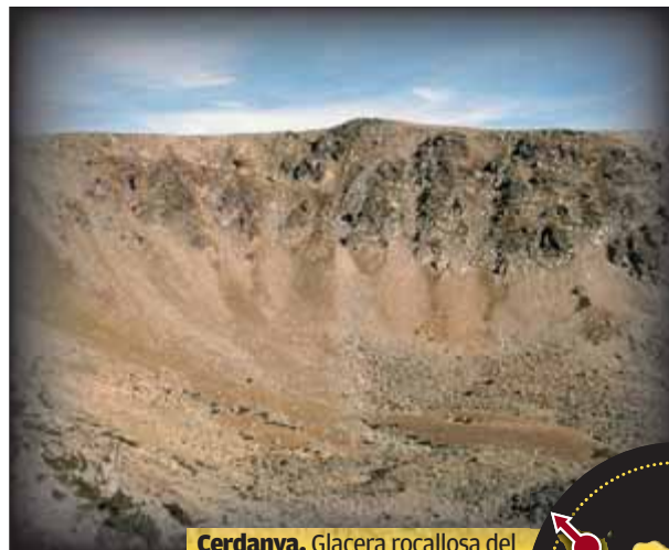
Cerdanya. Glacera rocallosa del clot de Malniu de Meranges

Un altre element únic de la península que es troba a la demarcació és la pedra cavallera oscil·lant de