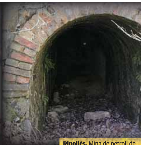
Ripollès. Mina de petroli de Sant Joan de les Abadesses