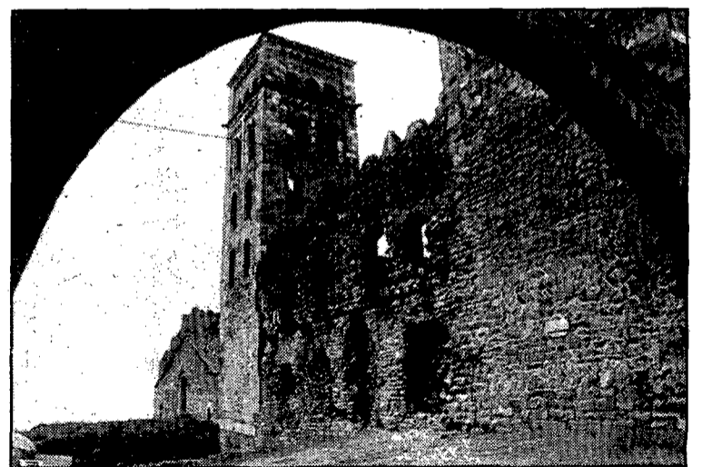
L'adscripció religiosa del monestir de Sant Pere de Roda, polèmica. (Foto JOAN SEGUR).

El rector recorda que amb motiu de celebrar-se la commemoració dels jubileus de la Santa Creu —el tres de maig de 1986—, es va promoure una cerimònia religiosa a la qual foren invitats diferents autoritats, entre les quals figurava el Rei, el vice-president del Govern i el President de la Generalitat, els quals, malgrat no assistir-hi, van enviar missatges d'agraïment per la deferència de ser cridats a participar en un acte d'aquestes carac-