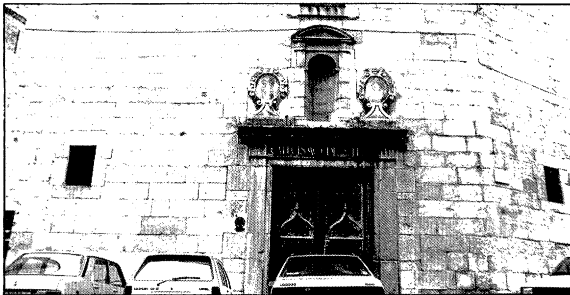
Sede de los «manaiés» y posible museo.

No es inmediato, pero ya se han dado los primeros pasos y hay los primeros compromisos. El obispado de Girona ha cedido el derecho de uso de la capilla de Sant Lluc a la Cofradía de Jesús Crucificado, por el tiempo que sea necesario y mientras sigan realizando sus actividades. Como se sabe, dentro de la cofradía están los «manaiés» que, además de su intervención en los desfiles procesionales de la Semana Santa, se ocupan, asimismo, de la organización de la Cabalgata de Reyes.