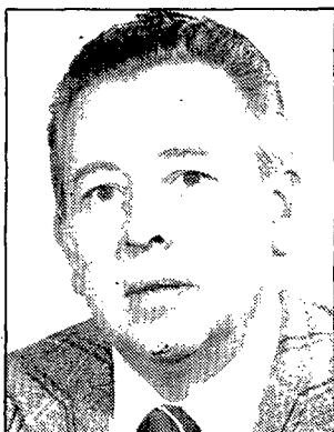
JAUME VERAY (AP)