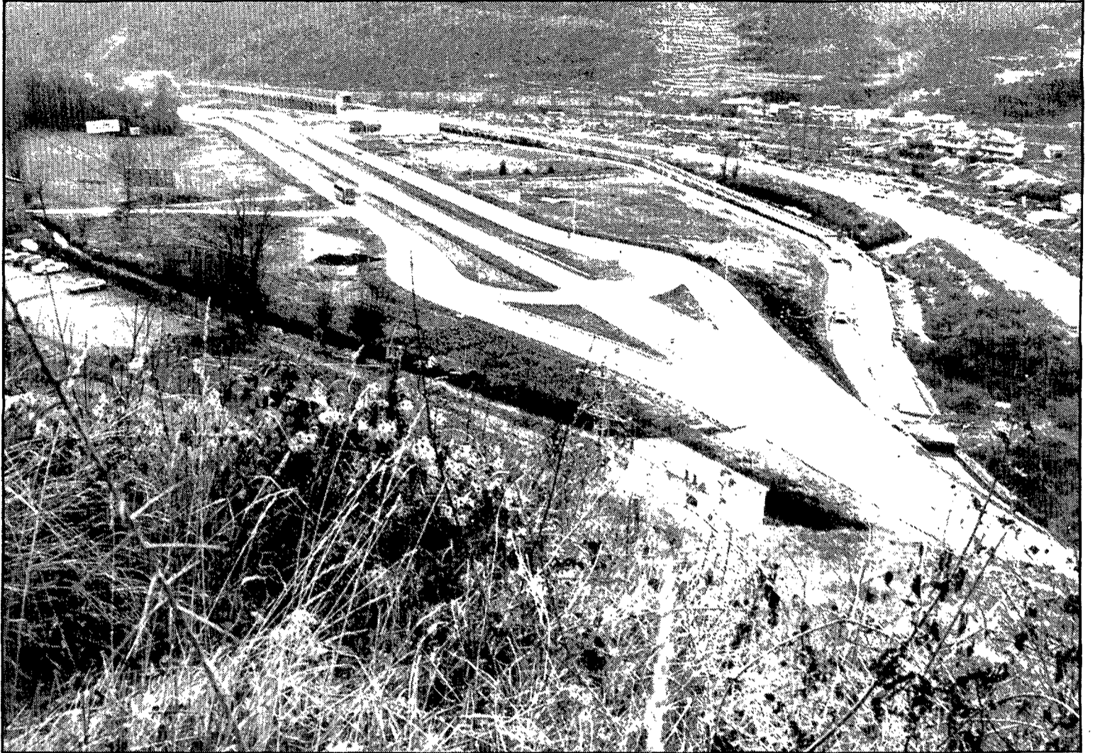
El polígon industrial del Ripollès està situat entre Ripoll i Campdevànol.

Fins ara, i segons Vilalta, les sol·licituds d'empresaris que s'han interessat a ocupar terrenys d'aquesta nova zona industrial han estat molt nombroses. Aquest fet ha despertat la possibilitat que no hi hagués el suficient sòl industrial per fer front a totes les peticions. «La seva situació al costat de la N-152 facilita molt l'entrada i sortida de mercaderies, suposem que aquest ha estat el motiu que ha atret a tants empresaris. Una altra raó també pot ser que aquesta serà la primera vegada que es disposi de zona industrial».