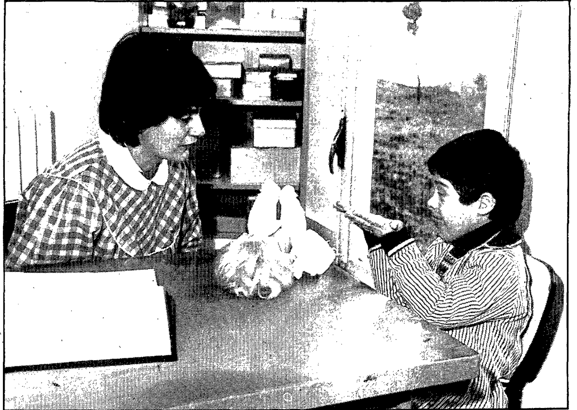
Avance en el reconocimiento profesional de los educadores especializados.