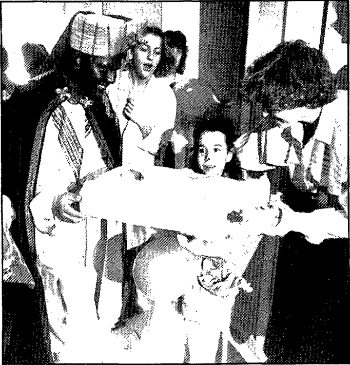
Los Reyes Magos visitaron el Hospital de Girona Alvarez de Castro. — En el día de ayer, con gran expectación por parte de pequeños y grandes, llegaron puntualmente a las diez de la mañana al Hospital de Girona, Alvarez de Castro, los Reyes Magos de Oriente. Melchor, Gaspar y Baltasar, acompañados de sus respectivos pajes, pasaron por todas las plantas de hospitalización visitando todos los enfermos ingresados, así como repartiendo juguetes y obsequios. En la instantánea de nuestro fotógrafo DANI DUCH puede observarse el momento de la entrega de los regalos a los más pequeños del centro.

Se celebró en Pamplona con el patrocinio del gobierno de Navarra