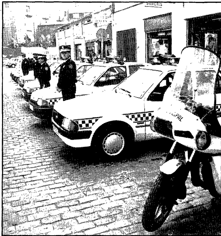
La Policía Municipal ha aumentado su plantilla.

Ayer mismo pasaron a formar parte de la plantilla