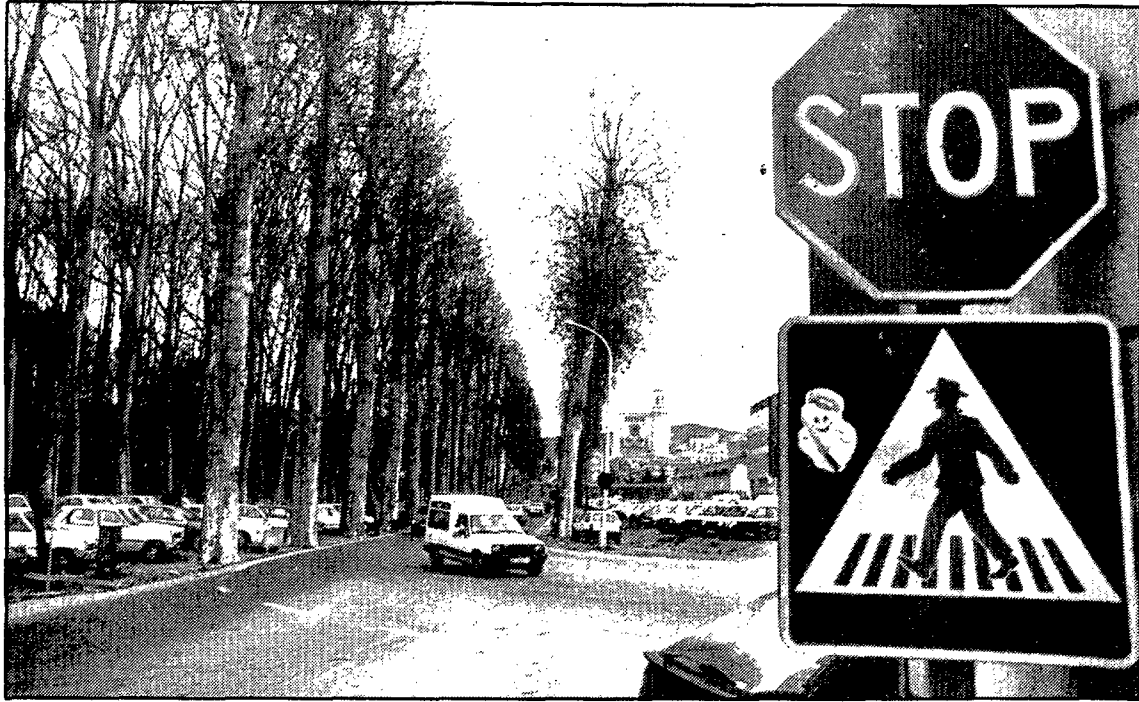
Un cruce verdaderamente peligroso.

Es posible. A lo mejor es que están esperando que se apruebe el plan especial de la Devesa para dar una salida válida a este tema. Nada tenemos que objetar, sobre todo si se hace rápidamente, porque lo que deseamos es eso. Pero hasta que llegue ese momento, no cabe la menor duda de que ese cruce que refleja la fotografía y que la casi totalidad de los conductores gerundenses conocen, es un cruce peligroso. Y alguna cosa debe hacerse.