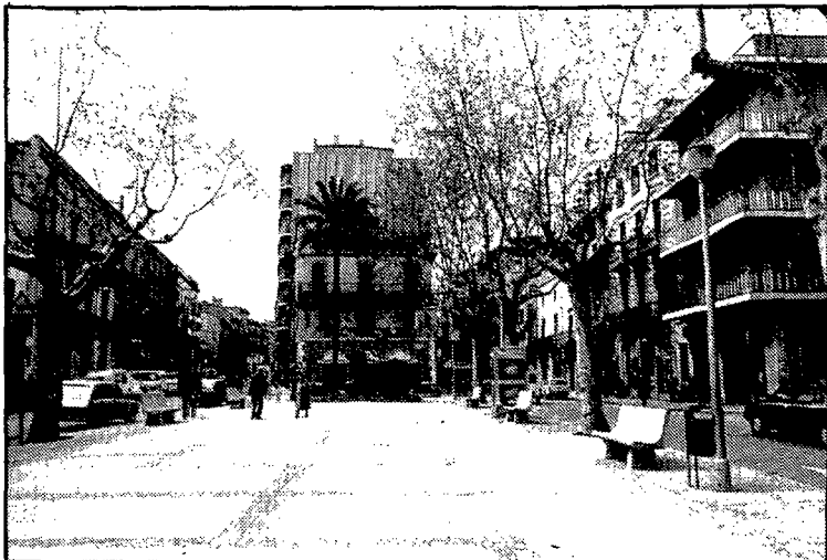
Els pressupostos de Figueres d'enguany pugen dos-cents noranta milions més que els del 87.

Al llarg de les darreres reunions de la comissió d'hisenda s'ha vist