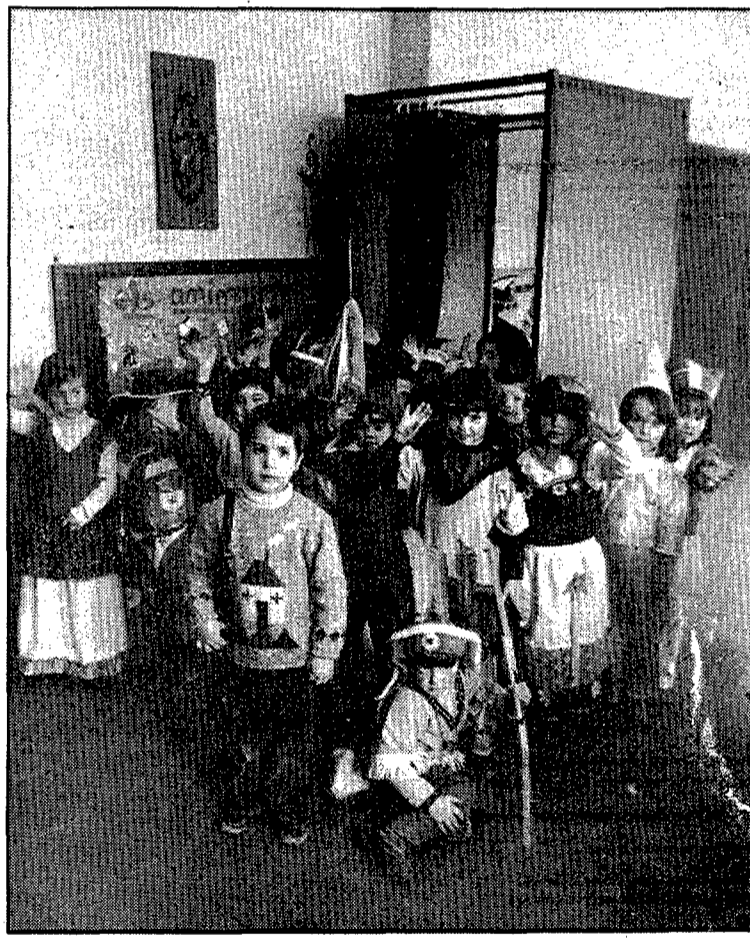
!Coincidint Carnestoltes i vigília d'eleccions, moltes escoles s'han convertit en col·legis... electorals. I els nens s'ho han passat bé jugant a dins les cabines...