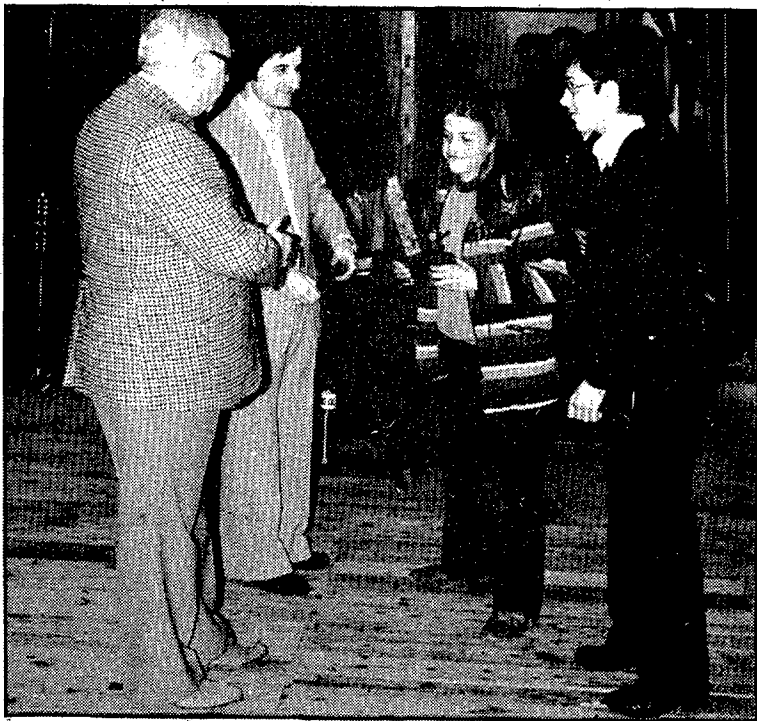
La colla «Malnada» d'Olot recullint el premi

Els actes es tancaren amb un dinar de germanor, en finalitzar el qual parlaren el delegat de les colles sardanistes, i un dels organitzadors de la esta d'Olot, coincidint en què la germanor era el qualificatiu més adient per aquesta jornada, i en el desig de celebrar el proper any la cloenda 1979 amb igual camaraderia i éssent tots junts.