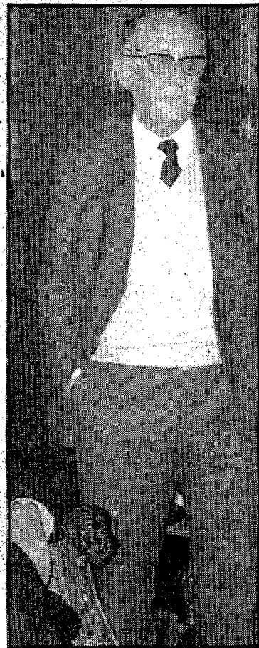
El senyor Xucà, president de la Diputació de Girona.

Cal recordar, però, que la Diputació de Girona, en el seu últim ple, va acordar d'ajornar els traspassos fins la convocatòria del nou ple sortit de les eleccions municipals del tres d'abril.