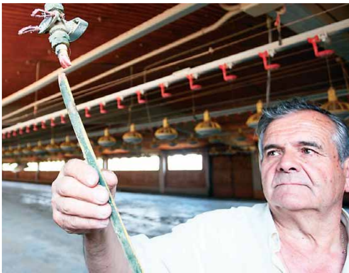
Granja d'aviram a Sant Gregori, on han robat la instal·lació del gas per a la calefacció

Això explica que el mercat del reciclatge hagi crescut molt en els darrers temps. Sobretot arran la directiva WEEE per a la valorització dels residus elèctrics i electrònics, i això ha fomentat la indústria. Catalunya disposa d'una normativa prèvia i, per exemple, a Pont de Vilomara (Bages) hi ha des del 1995 una planta per al tractament i reciclatge de frigorífics. Actualment el 43% de les necessitats europees es cobreixen amb coure reciclat -un 44% d'aquest material prové de productes al final de la seva vida útil, i