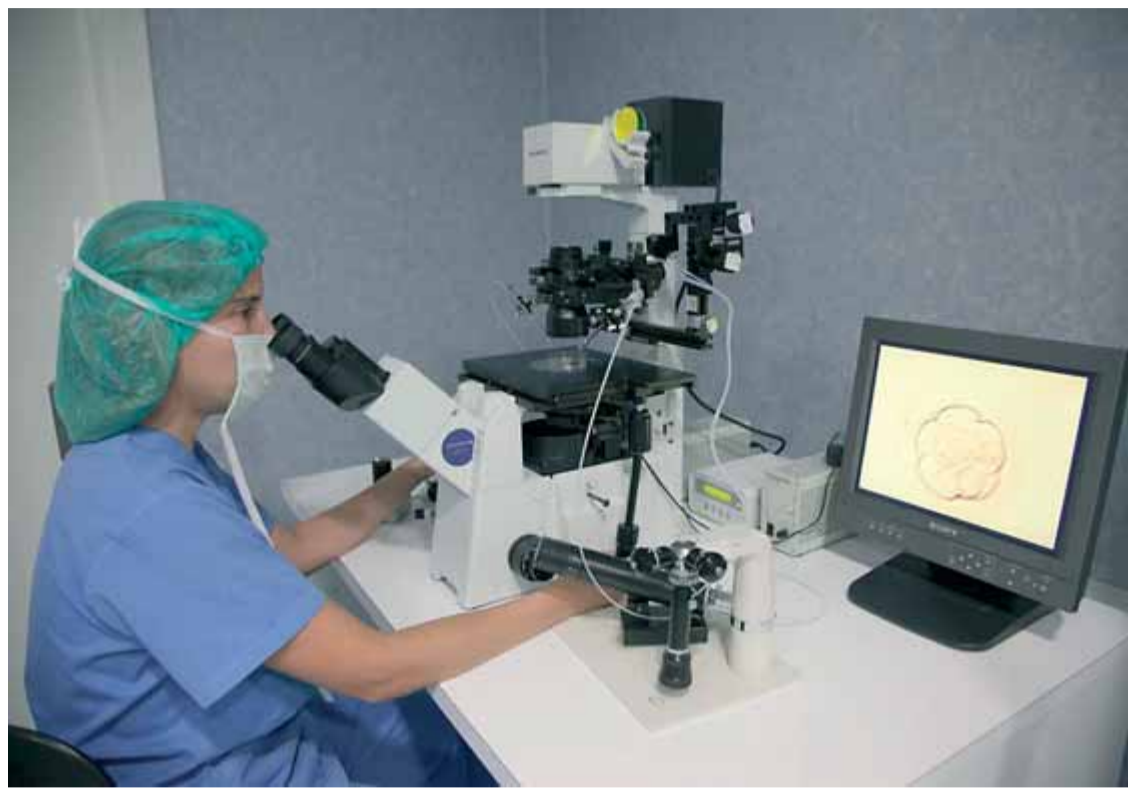
Imatge d'un centre de reproducció assistida de Tarragona.