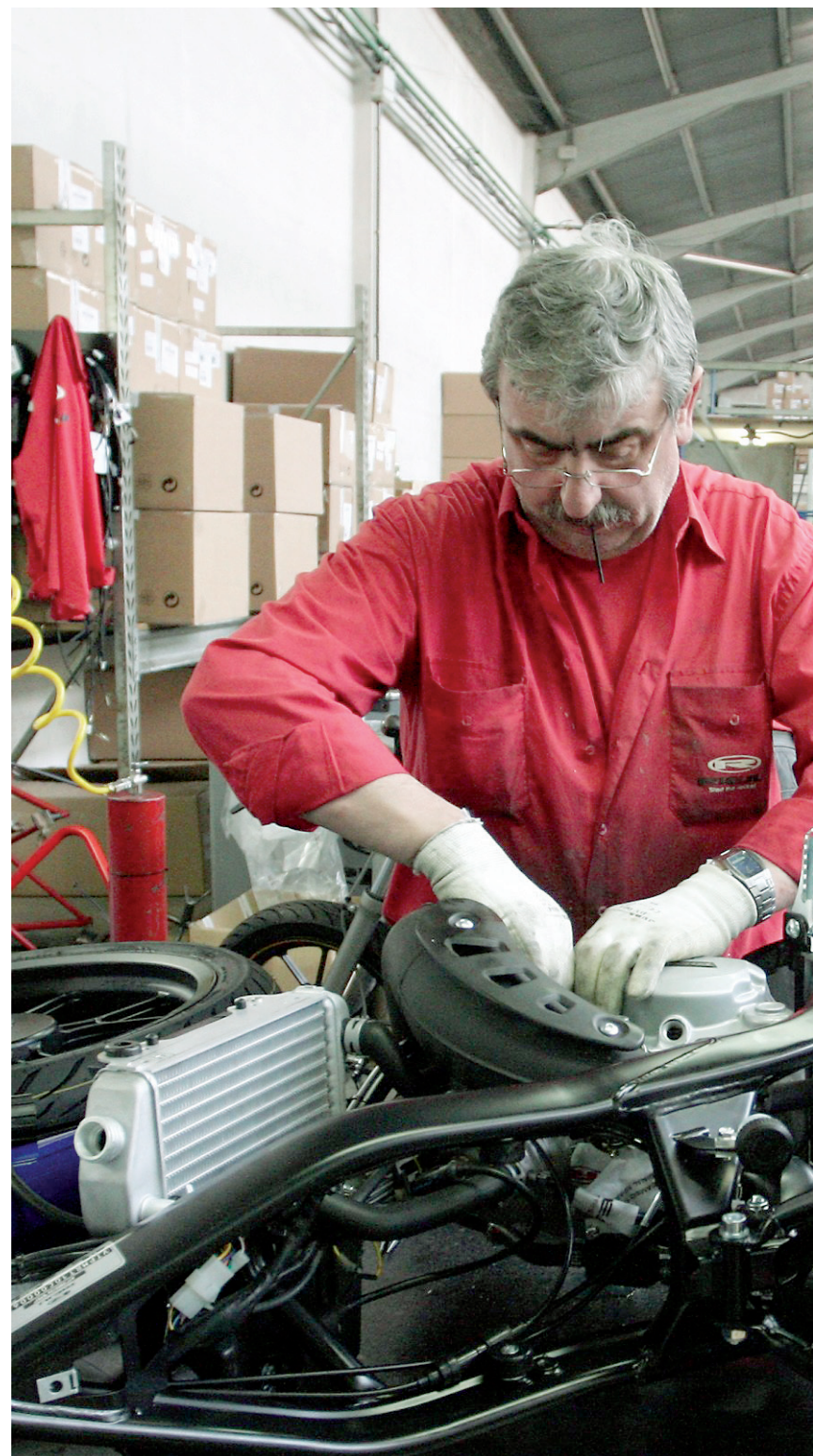
Operari de la fàbrica de motocicletes Rieju a Figueres.

persisteixen, el que sí que s'allunya és el temor d'una recaiguda, la temuda W. Així, la recuperació tindrà més aviat forma d'U però d'una U tan estirada i poc eixerida que fins i tot fa cosa fer servir aquesta vocal. En aquests casos, alguns experts prefereixen parlar de recuperació en \sqrt{\quad} , lenta i llarga. I fràgil, afegiríem.