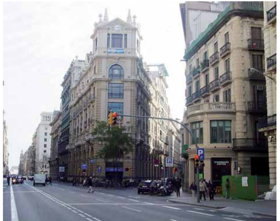
Seu barcelonina del Col·legi d'Enginyers Industrials de Catalunya.

El procés de selecció és un dels aspectes claus del Fons Enginyers. De fet, hi haurà diversos filtres per escollir els millors projectes. Un d'aquests filtres és el que examinarà el procediment tècnic, i està constituït per les comissions especialitzades tant del Col·legi d'Enginyers Industrials de Catalunya com per l'Associació Catalana d'Enginyers de Telecomunicacions. Després, el projecte presentat haurà de passar l'anàlisi financera i, finalment, el comitè d'inversions, constituït per l'òrgan permanent del fons d'inversions, l'aprovarà. Sigui com sigui, la previsió dels impulsors del fons dona una forquilla d'entre 10 i 12 projectes que podran rebre els recursos per constituir empreses innovadores, en fases inicials, pro-